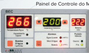
Painel de Controle do Módulo Circulador de Água/Bateria