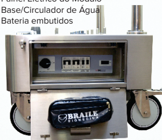
Código de Estoque 117900 Máquina Circulação Extracorpórea BEC