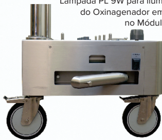
Painel Elétrico do Módulo Base/Circulador de Água/Bateria embutidos