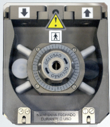
Módulo Bomba com ajuste de Oclusão central e detector de fechamento da tampa de proteção. Perfil "ohmega" menor hemólise