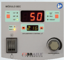
Painel de Controle do Módulo Bomba